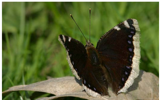
Rečiausia drugių rūšis Lietuvoje yra šėriai.

Ar dabar galėsi atskirti naktinius nuo dieninių drugių? Ar tau buvo įdomu apie tai skaityti?