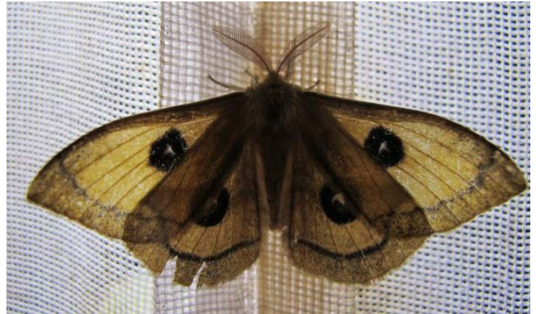
Naktinių drugių antenos apaugusios plaukeliais.

Trečias skirtumas: dieninius drugius traukia ryškių spalvų gėlės. Naktinius drugius traukia gėlės, kurios labai kvepia.