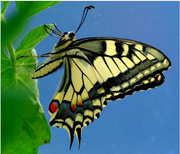
Dieniniai drugiai nutūpę sparnelius suglaudžia stačiai.

Antras skirtumas: naktinių drugių antenos yra apžėlusios plaukeliais, o dieninių drugių antenos turi buoželes ant galūnių.