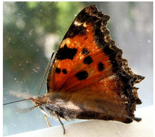
Gausiausia drugių rūšis Lietuvoje yra dilgėlinukai.

Trečias skirtumas: dieninius drugius traukia ryškių spalvų gėlės. Naktinius drugius traukia gėlės, kurios labai kvepia.