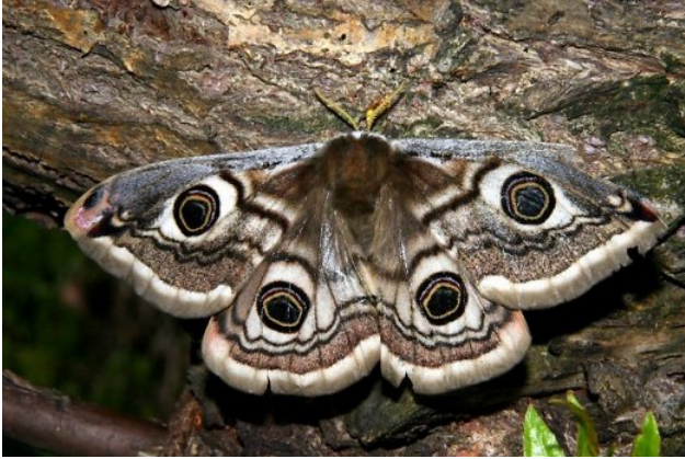
Naktiniai drugeliai nuleidžia sparnus prie šonų.

Drugių yra dvi grupės: naktiniai ir dieniniai. Dieniniai drugiai paprastai nutūpę sparnelius stačiai suglaudžia, o naktiniai juos nuleidžia prie šonų.