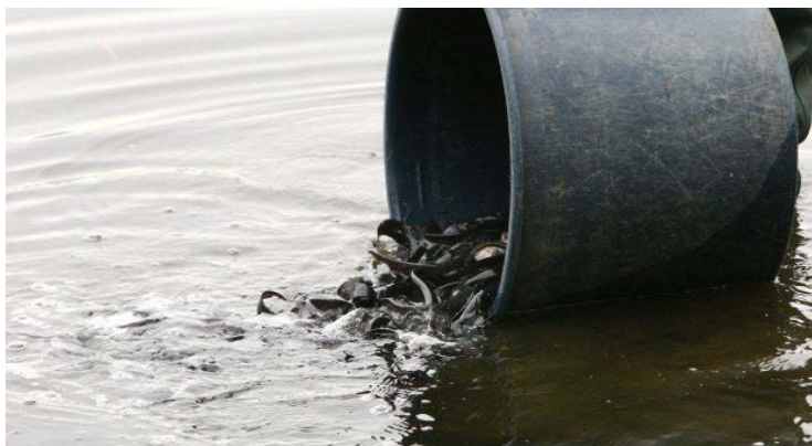
Į Kauno marias paleidžiami šamai jaunikliai.

Šamus į ežerus paleidžia labai mažus. Žvejams draudžiama pagauti šamą, kuris dar nėra išaugęs iki