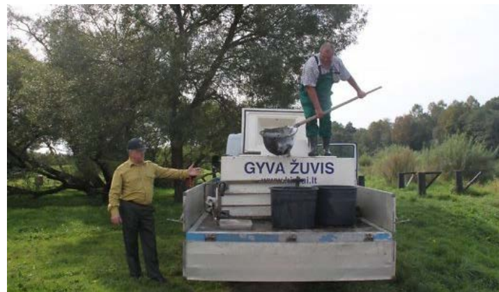
Iš tanko išima žuvus ir įmeta į kibirus.

Eršketai į Nerį ir Šventąją išleidžiami sveriantys bent svarą. Kiekvienas eršketas turi žymeklį su numeriu. Žuvininkystės tarnyba prašo žvejų jiems pranešti, jei pagauna žymėtą eršketą. Taip jie gali sekti, kur šios žuvis nuplaukia. Kadangi eršketas įrašytas į Raudonąją knygą, juos žvejoti yra draudžiama.