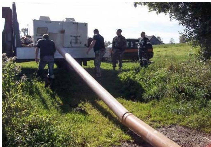
Iš tanko per vamzdį paleidžia lydekas į ežerą.

Kasmet Lietuvos valdžia pasirūpina, kad neišnyktų žuvis iš Lietuvos upių ir ežerų. Šiais metais buvo planuojama į upes ir ežerus paleisti 300 000 ungurių , 1,5 mln. vėgėlių , 3 mln. 400 tūkst. lydekų , 105 000 šamų , 10 tūkst. karosų , daugiau nei 600 karpių , 225 000 lašišų , 170 000 margujų upėtakių , 10 000 eršketų ir kitų žuvų.