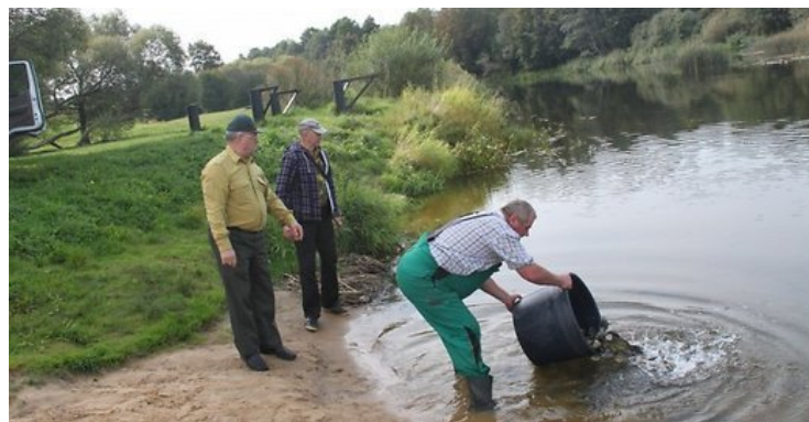
Iš kibiro žuvis paleidžia į ežerą.

Ar gerai, kad Lietuva rūpinasi žuvimis? Ar tau buvo įdomu skaityti apie įžuvinimą?