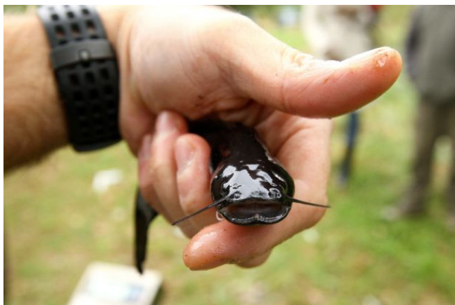
Šamo jauniklis.