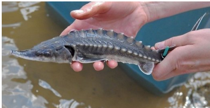
Eršketo jauniklis.

pustrečios pėdos . Jei mažesnį pagauna, turi grąžinti į vandenį.