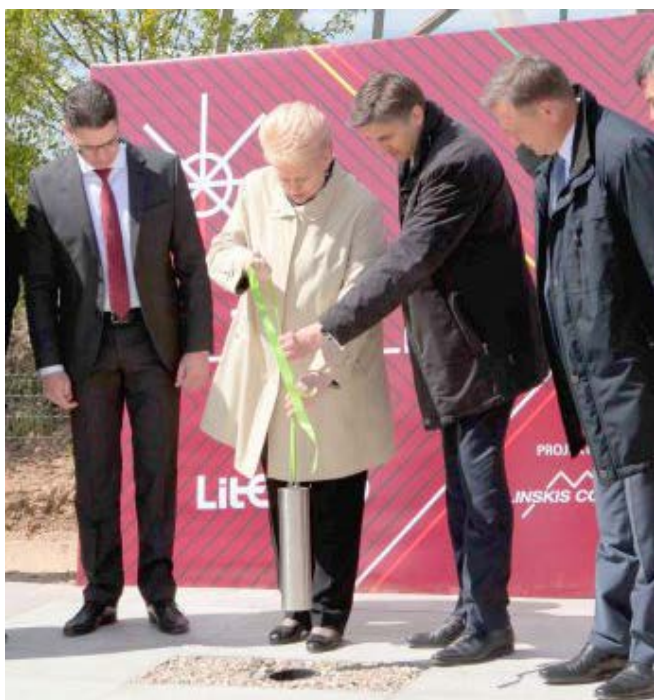
Prezidentė D. Grybauskaitė įleidžia kapsulę į žemę.

Projektas LitPol Link sujungs Lietuvos elektros linijas su Lenkijos elektros linijomis. Lenkijos elektros linijos yra sujungtos su visos Europos elektros linijomis. Tuo būdu Lietuva galės pasirinkti, iš kur pirkti elektrą.