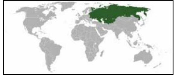
Tarybų sąjunga (pažymėta žaliai).

Armėnijos Tarybų Socialistinė Respublika (1922-1991) Azerbaidžano Tarybų Socialistinė Respublika (1922-1991) Baltarusijos Tarybų Socialistinė Respublika (1922-1991) Estijos Tarybų Socialistinė Respublika (1940-1991) Gruzijos Tarybų Socialistinė Respublika (1922-1991) Kazachijos Tarybų Socialistinė Respublika (1936-1991) Kirgizijos Tarybų Socialistinė Respublika (1936-1991) Latvijos Tarybų Socialistinė Respublika (1940-1991) Lietuvos Tarybų Socialistinė Respublika (1940-1990) Moldavijos Tarybų Socialistinė Respublika (1940-1991) Rusijos Tarybų Federacinė Socialistinė Respublika (1918-1991) Tadžikijos Tarybų Socialistinė Respublika (1929-1991) Turkmėnijos Tarybų Socialistinė Respublika (1925-1991) Ukrainos Tarybų Socialistinė Respublika (1922-1991) Uzbekijos Tarybų Socialistinė Respublika (1925-1991); USSR - Union of Soviet Socialist Republics