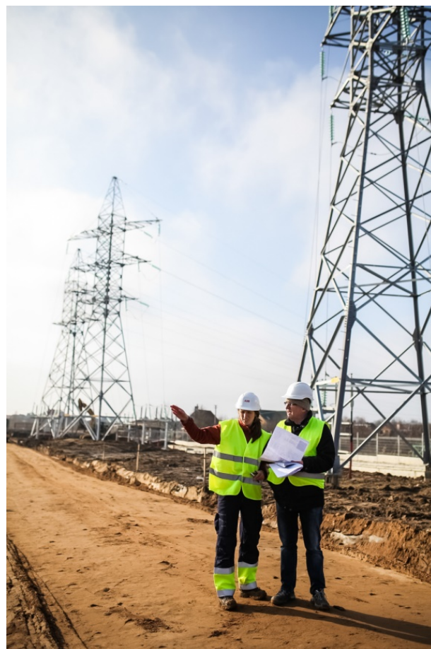
Vyksta LitPol Link statyba.

Dabar Lietuva labai brangiai moka už elektrą. Ateityje, ji galės rinktis elektrą už pigiausią kainą. LitPol Link yra toks svarbus projektas, kad prezidentė Dalia Grybauskaitė dalyvavo projekto pradžios ceremonijoje. Ji į žemę įleido kapsulę ateities kartoms. Joje įdėtas laiškas apie LitPol Link projektą ir jo svarbą Lietuvai.