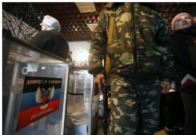
Prie balsavimo vietų buvo ginkluotų karių.

Tuo pačiu metu Rusija surengė rinkimus Ukrainos regionuose Donecke ir Luganske. Tuos rinkimus laimėjo prorusiškos partijos. Vienintelė valstybė, kuri pripažino šiuos rinkimus, buvo Rusija.