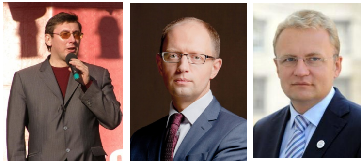
Laimėjusių partijų vadai Jurijus Lucenka, Arsenijus Jaceniukas ir Andrijus Sadovijus.

Rinkimų rezultatai buvo paskelbti lapkričio 1 d. Rinkimus stipriai laimėjo provakarietiškos partijos. Prorusiškos partijos rinkimus aiškiai pralaimėjo.