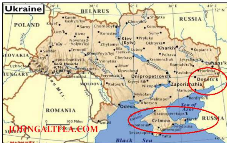
Ukraina. Krymas ir Doneckas pažymėti skrituliais.

Ukrainiečiai nori priklausyti Europos sąjungai (ES) . Rusai nori, kad jie priklausytų Muitų sąjungai . Pirma Rusija siuntė pinigus į Ukrainą. Kai Ukrainiečiai išvarė korumpuotą prezidentą Janukovičių, Rusija išsiuntė kariuomenę į Ukrainą, užėmė Krymą ir įsitvirtino Donecke.