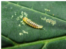
Keršakandės vikšras ant lapo.

Iš kiaušinių išsiritą vikšras . Vikšras virsta lėliuke , o iš lėliukės išsilukštėna kandis. Ji vėl deda kiaušinėlius, ir taip daugėja keršakandžių populiacija.