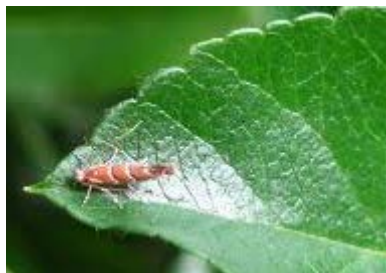
Keršakandė ant lapo.