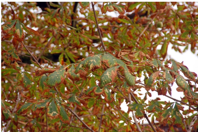
Keršakandžių pažeisti kaštonų lapai.

2002 m. iš Makedonijos į Lietuvą atkeliavo keršakandė. Jos vikšras gyvena kaštonų lapuose, po lapo oda. Dėka vikšrų lapai paruduoja, sudžiūsta ir nukrenta.