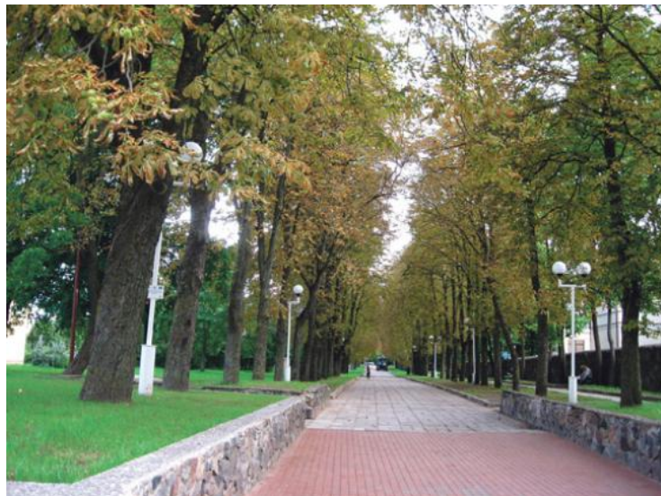
Pažeistų kaštonų alėja.

Nuo keršakandžių kaštonai silpnėja, bet nemiršta. Tik negražiai atrodo. O anksčiau jie būdavo miestų ir parkų puošmena. Dėl to lietuviai labai norėtų išnaikinti keršakandę.