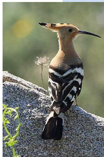
Čia taip pat

randama durpių . Verslininkai atliko detalius tyrimus šioje teritorijoje ir nustatė, kad paukščių, o ir šiaip gamtos, ten tarsi ir nėra! Jiems buvo duotas leidimas kasinėti pievose.