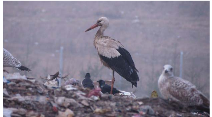
Gandras ieško maisto šavartyne.

Prie Klaipėdos esančiame savartyne per žiemą pasiliko trys gandrai ir sėkmingai atlaikė žiemos šalčius. Maisto susirasdavo šviežiai išverstose atliekose o nakvojo netoli esančiuose gandalizdžiuose. Kovo vidury jie jau išskrido į savo lizdus.