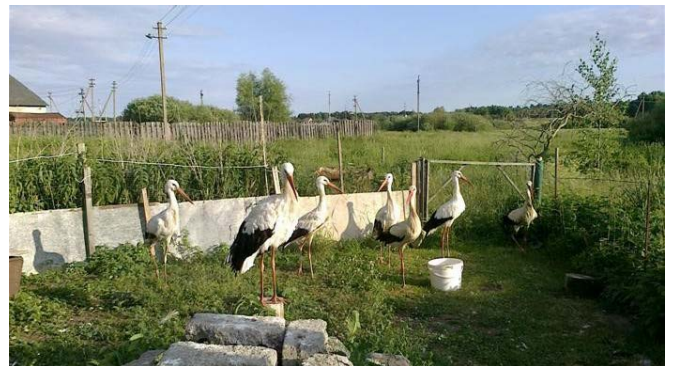
Gandrų prieglauda prie Utenos.

Utenos rajone yra gandrų prieglauda, kurioje žmonės prižiūri sužeistus gandrus. Dažnai jie būna sužeistais ar sulaužytais sparnais.