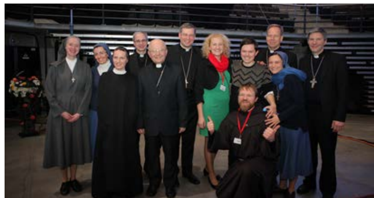
Kauno arkivyskupijos kurijos nariai ir sielovados pagalbininkai.

Tūkstančiai jaunų žmonių susirinko į šį renginį - buvo pilna Žalgirio arena , kur programa vyko.