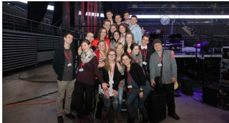
Jaunieji talkininkai.

Programą surengė Kauno arkivyskupijos kurija su sielovados pagalbininkais. Jiems talkininkavo jaunimas.