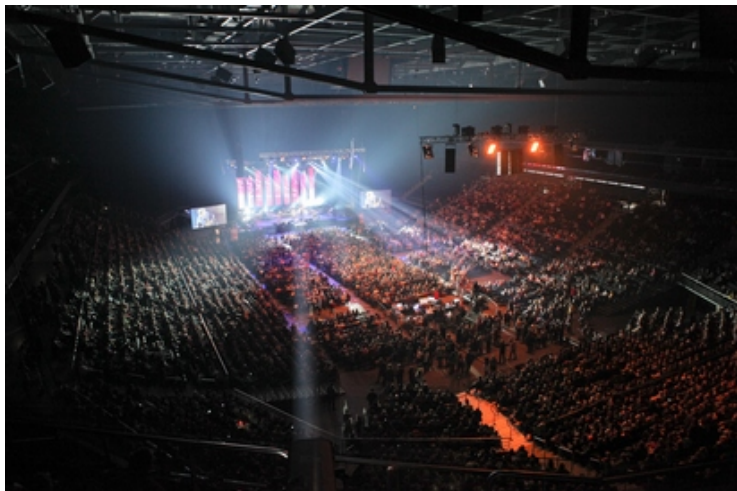
„Mylėk ir daryk, ką nori“.

Jau aštuntus metus kauniečiai Valentino dieną švenčia kitaip. Vyksta programa „Mylėk ir daryk, ką nori.“