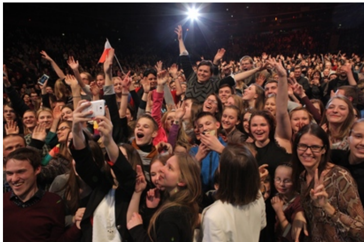
Jaunimas mėgsta programą „Mylėk ir daryk, ką nori“.

Tūkstančiai jaunų žmonių susirinko į šį renginį - buvo pilna Žalgirio arena , kur programa vyko.