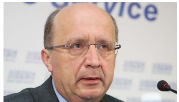
Buvęs Lietuvos Ministras pirmininkas A. Kubilius.

Jau daug Putino kritikų buvo nužudyti, o jų žudikai nerasti. 2006 m. buvo nužudyti opozicijos žurnalistė Ana Politkovskaja ir Putino kritikas Aleksandras Litvinenko, 2009 m. - advokatas Stanislavas Markelovas, opozicijos žurnalistės Anastazija Barburova bei Natalija Estemirova ir buchalteris Sergejus Magnitskis.