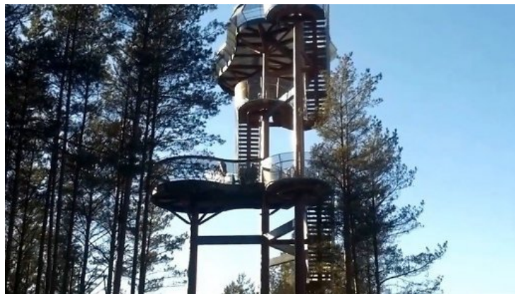
Merkinės apžvalgos bokštas.

Netoli Merkio ir Nemuno upių santakos stovi Merkinės apžvalgos bokštas . Iš čia galima regėti Dzūkijos gamtovaizdį.