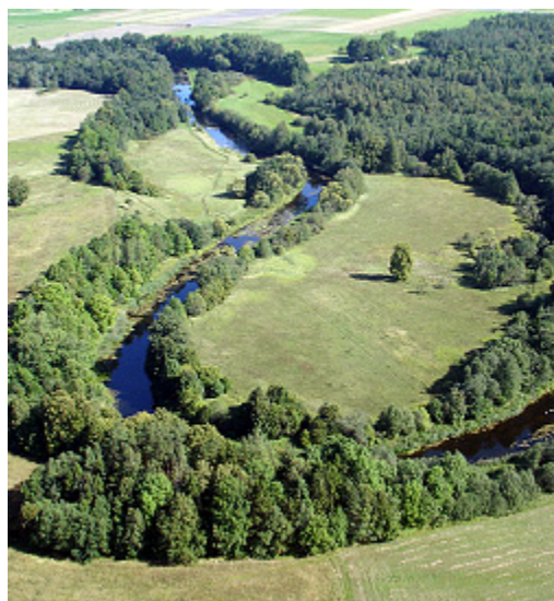
Vaizdas iš Ventės regioninio parko apžvalgos bokšto.

Atrodo, kad lietuviai myli medžius. O tu? Ar norėtum pasivaikščioti tarp medžių viršūnių?