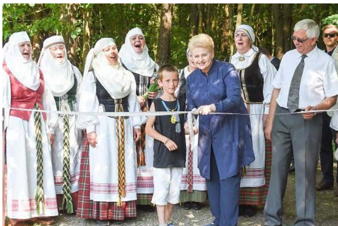
Prezidentė Grybauskaitė atidaro medžių lajų taką.

Tako atidaryme dalyvavo prezidentė Dalia Grybauskaitė. Ji taip pasakė: „Išties džiaugiuosi, kad toks objektas čia yra, kad žmonės galės visais metų laikais apsilankyti, nes medžiai ir miškas gražūs visada.“