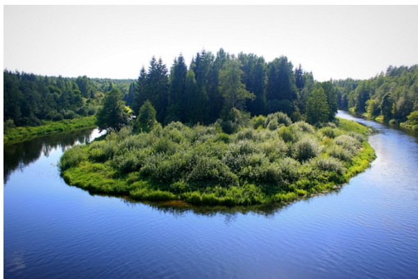
Šventoji - labai vingiuota upė.

Takas prasideda netoli Puntuko akmenų . Jis yra beveik ketvirtį mylios ilgumo. Iš čia gerai matosi Šventosios upės vingiai ir saugomas miškas.