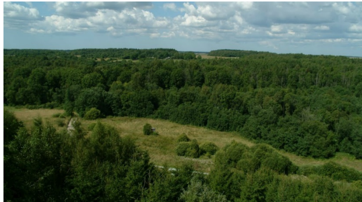
Vaizdas iš Kalnalio apžvalgos bokšto.

Nors tai pirmas medžių lajų takas, Lietuvoje jau stovi bent 25 apžvalgos bokštai . Iš Kalnalio apžvalgos bokšto matosi Žemaitijos gamtovaizdis.