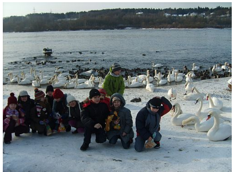
Trečio skyriaus mokiniai su mokytoja lesina gulbes Kaune prie Nemuno.

Ornitologai perspėja : jei maitini paukščius rudenį, būtina juos maitinti reguliariai visą žiemą. Jie bus pripratę iš tavęs gauti reikiamo peno , nemokės jo surasti kitur ir žūs.