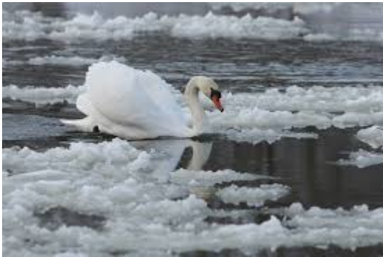
Gulbė nebylė.

XX amžiaus viduryje gulbės Lietuvoje buvo beveik išnykusios. Vieno žmogaus - Tado Ivanausko - rūpesčiu, gulbių populiacija Lietuvoje atsikūrė. Įprasta gulbių rūšis Lietuvoje yra gulbė nebylė, kuri neišduoda jokio garso.