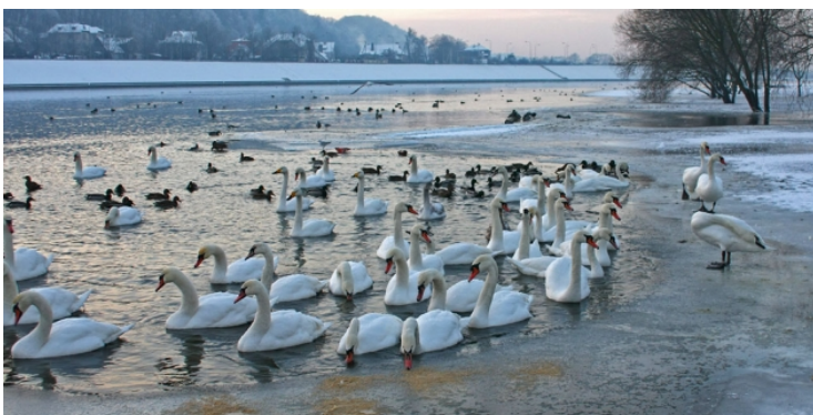
Gulbės žiemą susitelkia į būrius vandens telkiniuose.

Lietuvoje žiemos būna pakankamai šiltos, kad gulbės ten žiemotų. Žiemą jos susitelkia į būrius ir gyvena vandens telkiniuose, kurie neužšąla. Jos minta žmonių paliekamu lesalu.