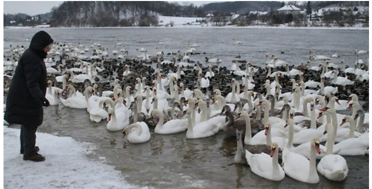
Didžiausia Lietuvos vandens paukščių lesykla yra Kaune, prie Nemuno.

Lietuvos ornitologų draugija (LOD) , padedant savanoriams, kas žiemą reguliariai maitina Nemune žiemojančias gulbes.