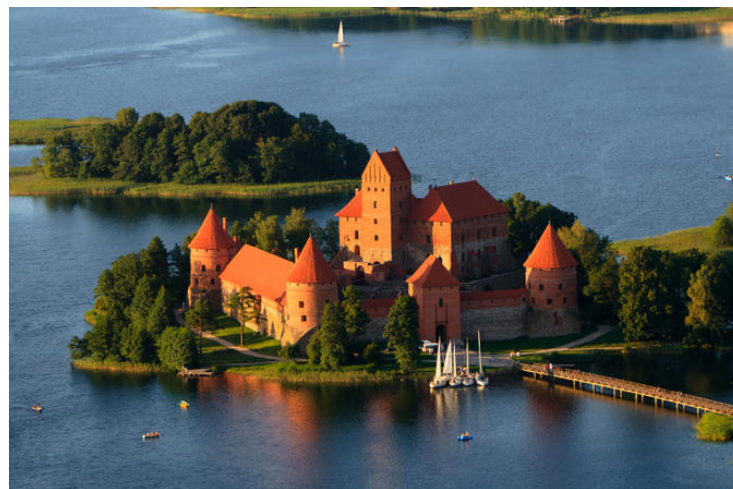
Trakų pilis.

Taip pat siūlo aplankyti Kauną, Palangą, Druskininkus, Šiaulius ir kitas vietas. Apie Žemaitijos nacionalinį parką rašo: „...Stebuklingas ežerų ir miškų kraštovaizdis yra paslaptingas. Jis toks gražus, kad lengva suprasti, kodėl taip daug lietuvių legendose ir pasakose yra velnių, vaiduoklių, palaidotų lobių.”