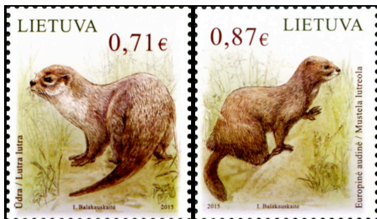
2015 m. Lietuvoje išleisti nauji pašto ženklai. Ūdra kairėje, audinė dešinėje.

Lietuvos paštas kasmet išleidžia naujus pašto ženklus, kuriuose pavaizduoti Lietuvoje nykstantys gyvūnai. Šiais metais ženklus papuošė audinė ir ūdra .