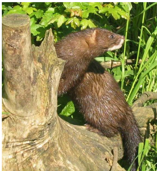
Europinė audinė.

Lietuvos paštas kasmet išleidžia naujus pašto ženklus, kuriuose pavaizduoti Lietuvoje nykstantys gyvūnai. Šiais metais ženklus papuošė audinė ir ūdra .