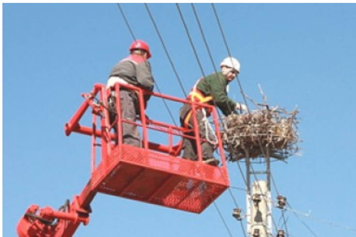
Gandro lizdas ant elektros lynų.

Kartais gandrai pasistato lizdą ant elektros vielų. Tai pavojinga. Juos gali nutrenkti elektra. O kai sušlampa lizdas, jo svoris gali nutraukti vielas, ir lizdas gali nukristi.