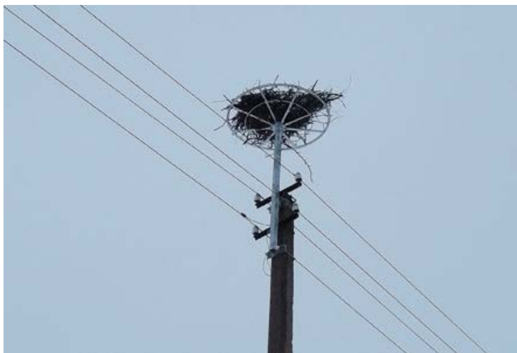
Gandro lizdas ant platformos virš elektros vielų atramos.

Kartais gandrai pasistato lizdą ant elektros vielų atramos . Tai taip pat gali būti pavojinga. Žmonės pastato lizdams platformas, iškeltas virš vielų, toliau nuo pavojaus.