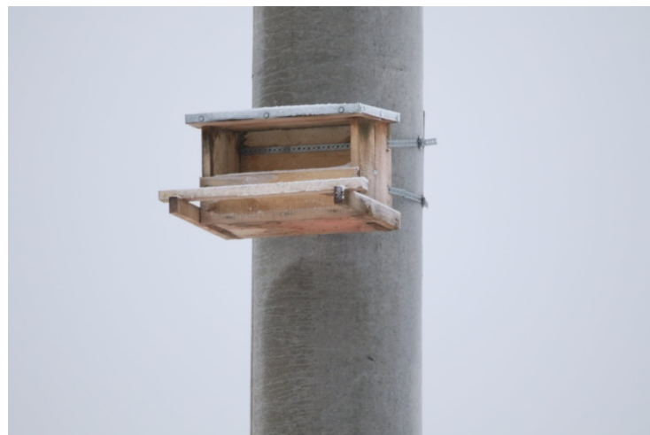
Inkilas pelėsakaliams.

Taip pat sutarė, jog ant elektros vielų stulpų pelėsakaliams bus iškabinti inkilai. Inkilai bus saugūs, neprieinami jokiems žinduoliams. Jie nebus statomi arti vielų, kur paukščiams ir jų mažyliams grėsia pavojus.