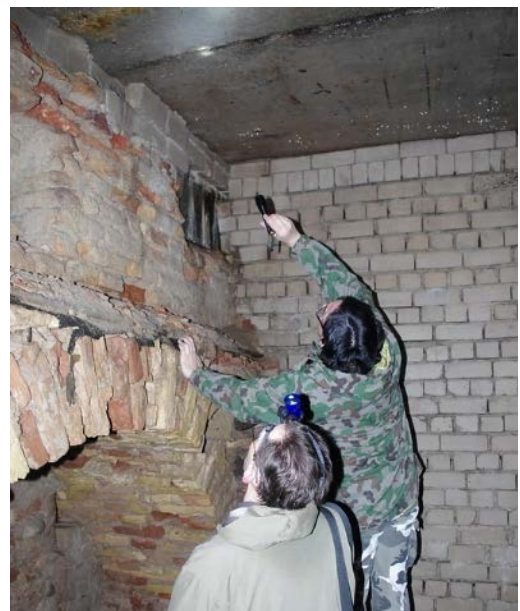
Skaičiuoja šikšnosparnius tunelyje.

Ar tau buvo įdomu skaityti apie šikšnosparnius?