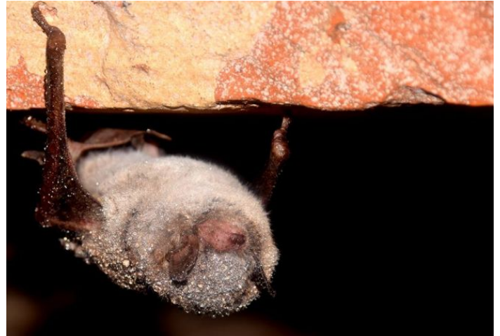
Žiėmojantis pelėausis.

Mokslininkai yra atsargūs, kad neprižadintų miegančių žvėrelių. Prižadinti jie turėtų ieškoti maisto – vabalų, tačiau visi vabalėliai žiėmą miega. Todėl iš miego pažadinti šikšnosparniai negalėtų išlikti gyvi.