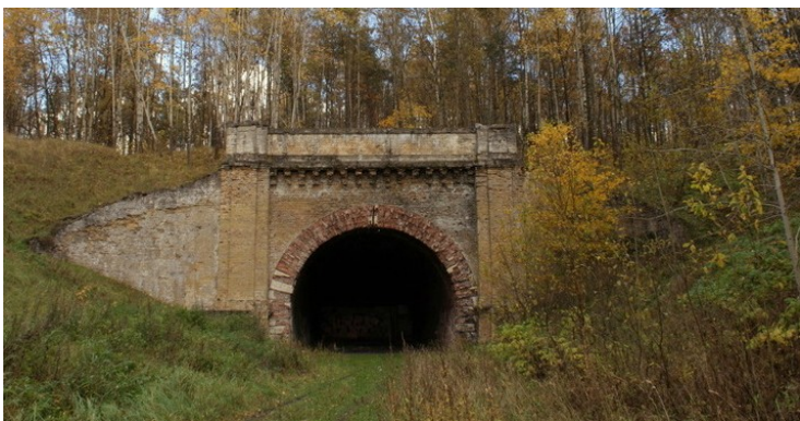
Aukštųjų Panerių geležinkelio tunelis.

Kūdrinis pelėausis žiemoja giliuose ir drėgnuose požemiuose, kur oro temperatūra nėra per žema. Žiėmodami jie kybo ant sienų arba slepiasi plyšiuose. Viena svarbi jų žiėmojimo vieta yra Aukštųjų Panerių geležinkelio tunelis .