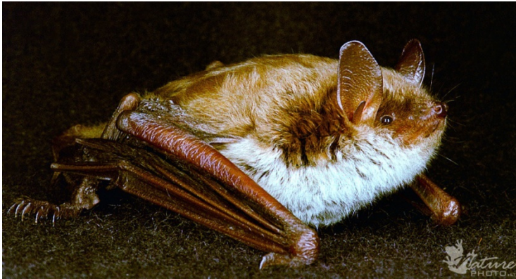
Kūdrinis pelėausis.

Kūdrinis pelėausis yra įrašytas į Lietuvos raudonąją knygą . Tai saugoma šikšnosparnių rūšis.