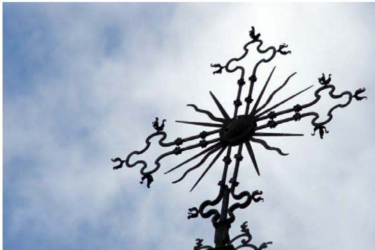
Autentiškas lietuviškas geležinis kryžius.

1948 m. birželį į Buriatiją buvo ištremta per 4000 Lietuvos gyventojų. Dėl išsekimo ar ligų čia mirė apie 800 lietuvių.