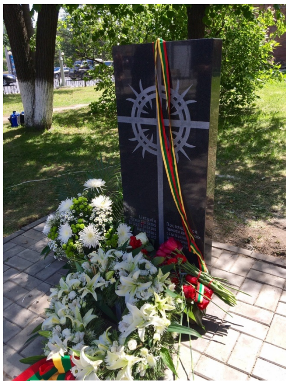
Tremtiniams paminklas Tomske.

Sibiro sritis Tomskas buvo viena pagrindinių lietuvių tremties vietų. Birželį ten buvo atidengtas paminklas Lietuvos tremtiniams atminti.