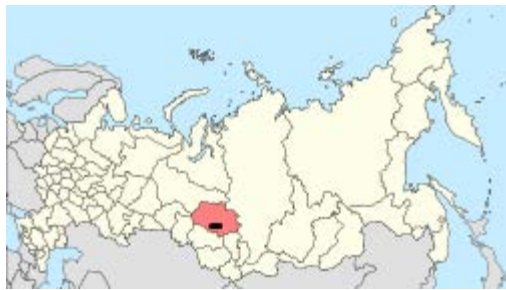
Tomsko sritis ir miestas (pažymėtas juodai). (wikipedia žemėlapis)

Sibiro sritis Tomskas buvo viena pagrindinių lietuvių tremties vietų. Birželį ten buvo atidengtas paminklas Lietuvos tremtiniams atminti.