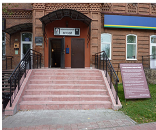
Memorialinis muziejus „NKVD kalėjimas“.

Jis pastatytas aikštelėje šalia memorialinio muziejaus „NKVD kalėjimas“. Ant jo lietuviškai ir rusiškai parašyta: „Lietuvių tremtiniams ir politiniams kaliniams atminti“.