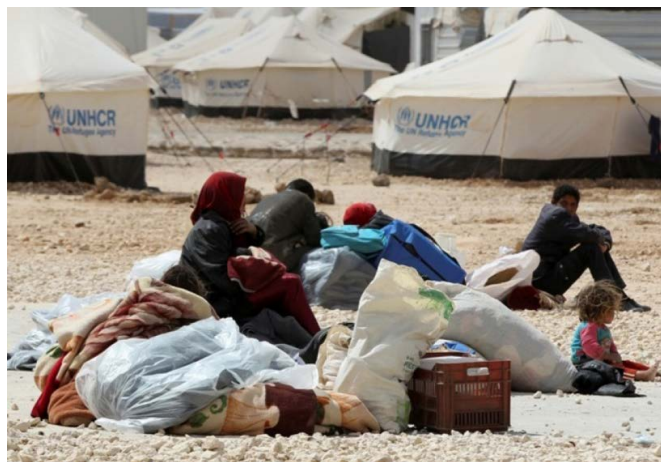
Pabėgėliai laukia prieglobsčio. (lsveikata.lt nuotr.)

Numatoma, kad 2016 m. pradžioje Lietuva priims dar 70 irakiečių. Lietuva teiks pirmenybę labiausiai pažeidžiamiems asmenims – šeimoms su vaikais.