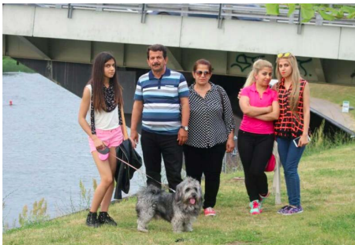
Irakiečių šeima, kuri jau gyvena Lietuvoje.

Irakiečiai tris mėnesius gyvens Pabėgėlių priėmimo centre Rukloje . Ten mokysis lietuvių kalbos ir susipažins su lietuvių kultūra. Vėliau tęs integraciją savivaldybėse .