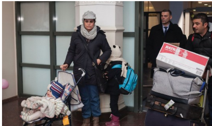
Irakiečių šeima prašo prieglobsčio Lietuvoje.

Gruodį į Lietuvą atskrido pirmieji pabėgėliai pagal sutartį su Europos Sąjunga (ES) . Jie yra irakiečiai . Į Lietuvą jie atvyko iš pabėgėlių stovyklos Graikijoje .