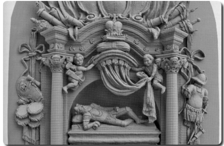
Taip atrodė Ostrogiškio antkapiu paminklas.

Ostrogiškis buvo palaidotas prie puikios Kijevo Pečorų lauros katedros. Katedra buvo sunaikinta per Antrąjį pasaulinį karą. Ją atstatė 2000 m. Tačiau lieka neatstatytas Ostrogiškio antkapiu paminklas .