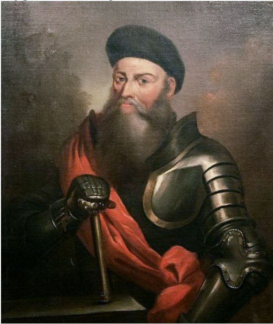
Didysis Lietuvos etmonas Konstantinas Ostrogiškis.

Konstantinas Ostrogiškis buvo Lietuvos didysis etmonas Žygimanto Senojo laikais (nuo 1497 m.).