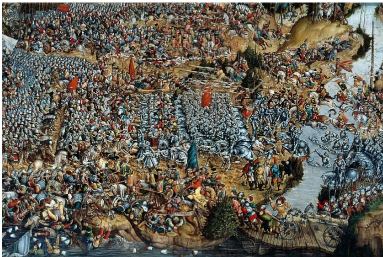
Oršos mūšio paveikslas.

Jo tėvelis buvo iš vietinių Voluinės kunigaikščių giminės. Jo motina – Lietuvos didžiojo kunigaikščio Algirdo palikuonė . Ostrogiškių giminė nuo XIV a. galo ištikimai tarnavo Lietuvos didiesiems kunigaikščiams.