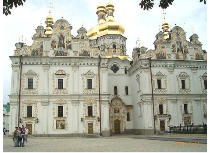
Kijevo Pečorų lauros dalis - katedra, kurioje palaidotas Ostrogiškis.

kariuomenės vadus ir patį vyriausią jos vadą. Oršos mūšis į pasaulio istoriją įėjo kaip vienas pirmųjų klasikinės artilerijos pasalos pavyzdžių.