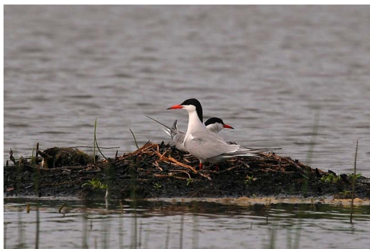
Perinti porta.

Seniau Kalvių žvyro karjere perėjo apie 200 upinių žuvėdrų .