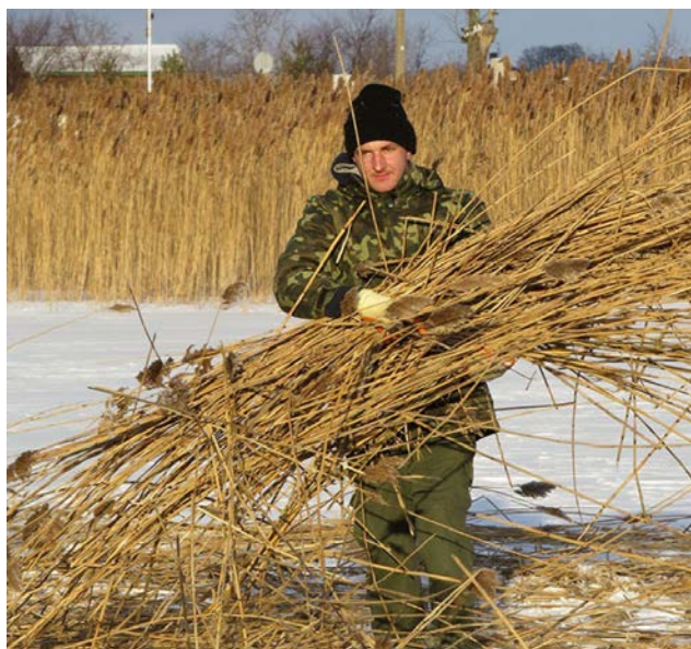
Apleistas karjeras apaugo žolėmis.

Ilgainiui karjeras buvo apleistas. Jis apaugo ndrėmis ir kitomis žolėmis. Žuvėdros nebegalėjo perėti jauniklių.