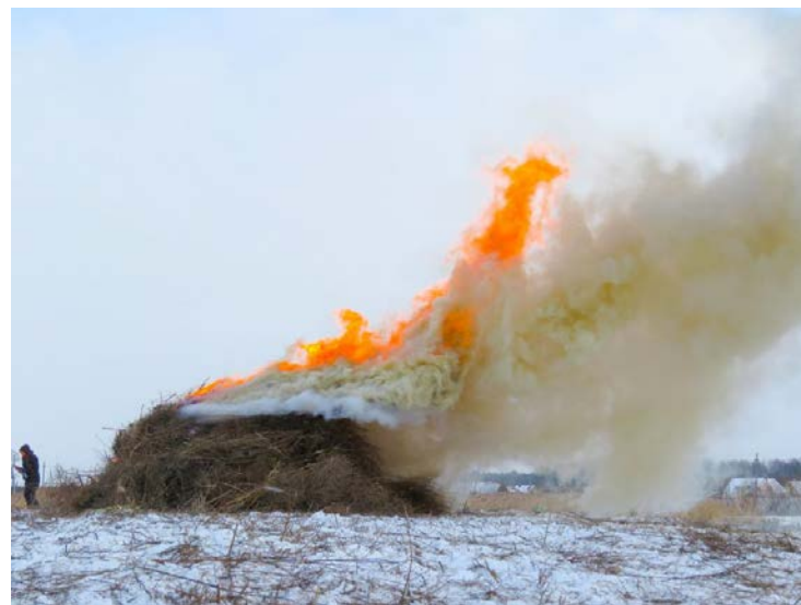
Gamtosaugininkai užkūrė laužą ir sudegino žoles.

Tam, kad ši paukščių rūšis neišnyktų, gamtosaugininkai užkūrė didžiulį laužą, kad sumažintų nendrinių ir žolių kieki.