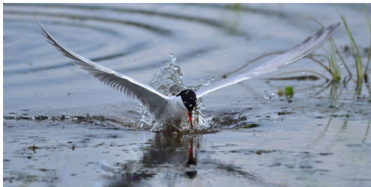
Upinė žuvėdra žuvauja.

Seniau Kalvių žvyro karjere perėjo apie 200 upinių žuvėdrų .