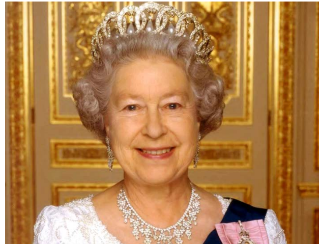
Didžiosios Britanijos karalienė Elžbieta.

Didžiosios Britanijos karalienė Elžbieta savo sveikinimo laiške palinkėjo daug laimės visiems Lietuvos žmonėms.