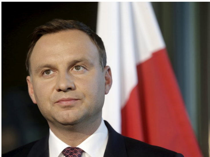
Lenkijos prezidentas Andrzej Duda.

Prezidentas Donaldas Trump'as atsiuntė prezidentei Daliai Grybauskaitei laišką, kuriame rašė: „Jungtinės Valstijos didžiuojasi , galėdamos Lietuvą vadinti drauge ir sajungininke <...> Lietuva yra vertinama NATO sąjungininkė, kuri rodo pavyzdį kitiems, vykdama isipareigojimus mūsų bendrai gynybai...”