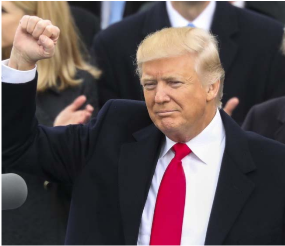
JAV prezidentas Donaldas Trump'as.

Vasario 16-osios proga Lietuva susilaukė sveikinimų iš įvairių šalių, tarp jų ir iš Jungtinių Amerikos Valstijų.