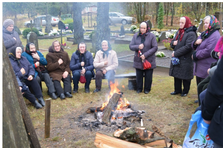
Margioniškių kaime uždegtas Vėlinių laužas.

Vienuose kaimuose žmonės dar puoselėja senuosius Vėlinių papročius . Aštuonias dienas kūrena Vėlinių laužus ir meldžiasi už savo mirusius. Pasakoja prisiminimus apie mirusiuosius.