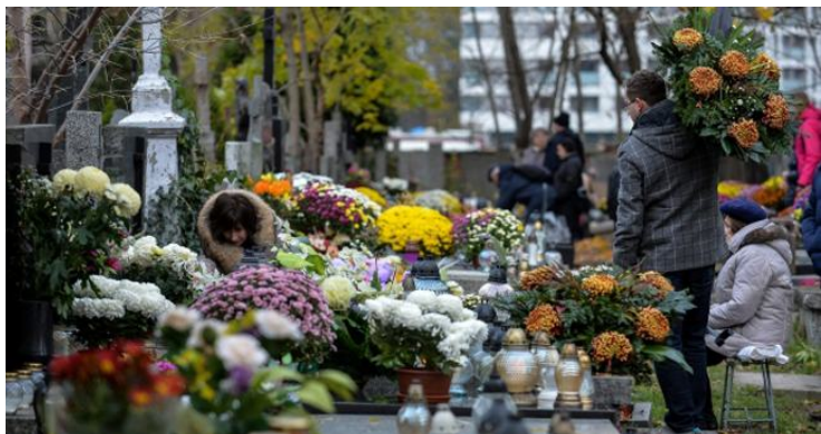
Per Vėlines kapus papuošia gėlėmis.

Vienuose kaimuose žmonės dar puoselėja senuosius Vėlinių papročius . Aštuonias dienas kūrena Vėlinių laužus ir meldžiasi už savo mirusius. Pasakoja prisiminimus apie mirusiuosius.