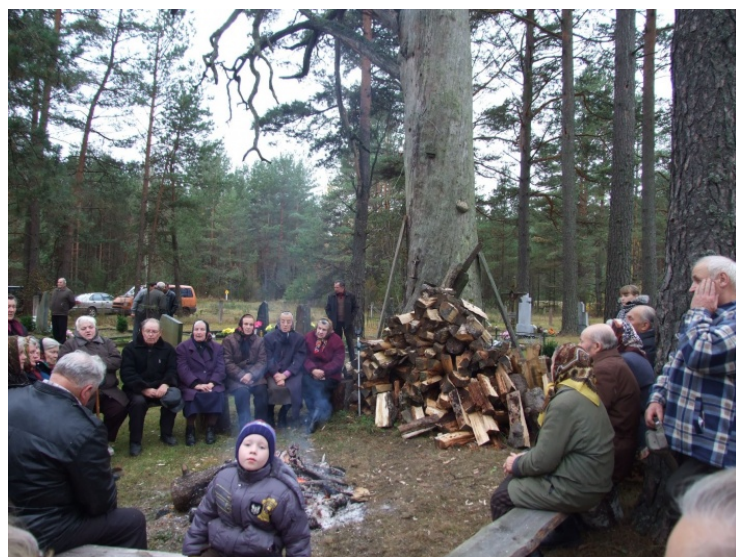
Vėlinių dieną Marioniškių kapinėse meldžiasi ir vaikai, anūkai, bei proanūkai.

Kiekvieną dieną per Vėlinių laikotarpį Margioniškių kaimo gyventojai susirenka pasimelsti ir prisiminti mirusiuosius. Vėlinių dieną atvažiuoja jų vaikai, anūkai ir proanūkai. Tą dieną jie visi kartu prisimena savo mirusiuosius ir už juos pasimeldžia.