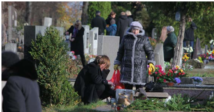
Per Vėlines lietuviai lanko kapus.

Vėlinės yra šventė, per kurią lietuviai prisimena savo mirusiuosius. Lietuvoje Vėlines švenčia lapkričio 1 d. Tą dieną žmonės nedirba. Jie lanko savo mirusiųjų kapus, uždega žvakes, papuošia gėlėmis, pasimeldžia.