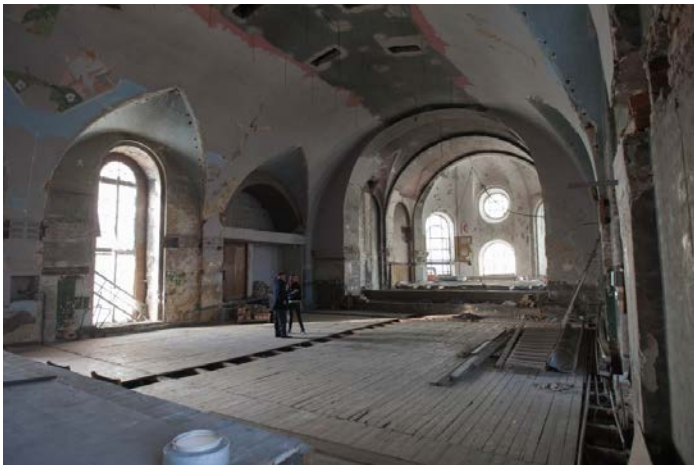
Švč. Sakramento bažnyčios sunaikintas interjeras.

1949 m. sovietai bažnyčią uždarė ir naudojo kaip knygų sandėlį . 1964 m. jie nusprendė bažnyčią paversti į kino teatrą. Visą interjerą sunaikino. Kad vitražai nebūtų sunaikinti, žmonės juos išmontavo ir sudėjo į dėžes.