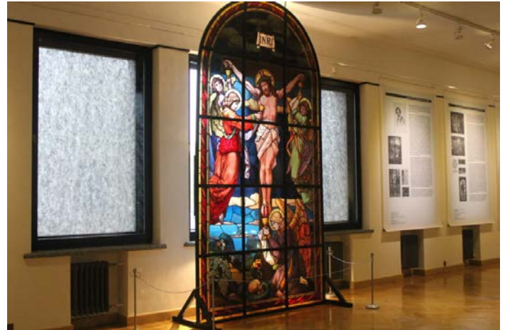
Švč. Sakramento bažnyčios vitražas muziejuje.

Dabar didysis altoriaus vitražas restauruotas. Jis stovi Nacionaliniame M.K.Čiurlionio dailės muziejuje. Tai vienas seniausių ir vertingiausių vitražų Lietuvoje.