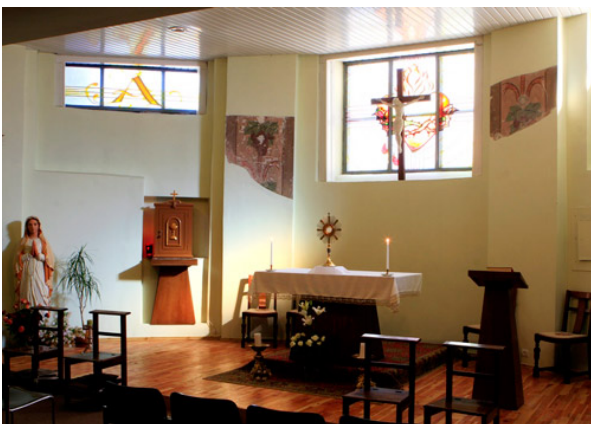
Koplyčia Švč. Sakramento bažnyčioje.

Atkūrus Nepriklausomybę, buvusio kino teatro kavinės patalpoje įsteigė koplyčią studentams.