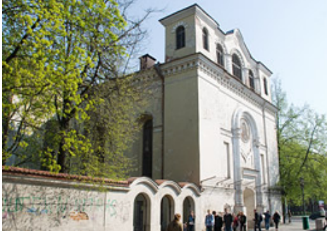
Švč. Sakramento bažnyčia Kaune.

1700 m. Kaune buvo pastatyta bažnyčia, kuri vėliau pavadinta Švenčiausio Sakramento bažnyčia. 1934 m. parapija įsigijo Austrijos menininkų sukurtus vitražus .