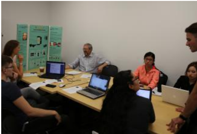
KTU komanda vysto idėją.

Silicio slėnio ekspertai džiaugiasi Kauno technologijos universiteto (KTU) studentų idėja. Pasak ekspertų, tai – geriausia pasaulinio masto naujovė.