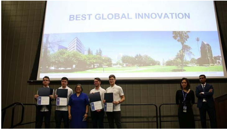
KTU studentai priima apdovanojimus už savo idėją.

Silicio slėnio ekspertai džiaugiasi Kauno technologijos universiteto (KTU) studentų idėja. Pasak ekspertų, tai – geriausia pasaulinio masto naujovė.