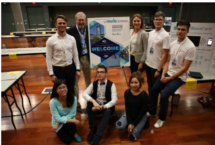
KTU komanda.

Savo idėją studentai išvystė Silicon Valley Innovation Challenge konkursui. Komandoje dalyvavo septyni KTU ir trys San Jose universiteto studentai.