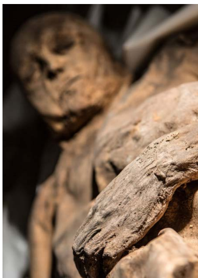
Vaiko mumija, rasta Vilniuje.

prieš 4000 metų žmonės Egipte sirgo kažkokia liga, kuri panaši į raupus. Ar tai iš tiesų buvo raupai?