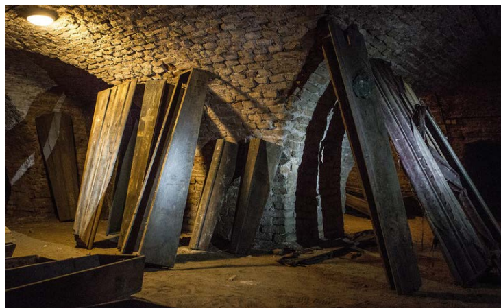
Kripta, kurioje rado vaiko mumiją su raupų virusu.

Vilniaus, McMaster, Helsinko ir Sydney universitetų mokslininkai palygino mumijoje rastus virusus su 1944-1977 m. laikotarpio virusais. Remdamiesi tyrimais jie padarė įdomią išvadą – Egipto raupai buvo sukelti visai kitų virusų, nei tie, nuo kurių atrado skiepa.