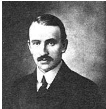
Ministras pirmininkas Pranas Dovydaitis.

Kai Tarybų sąjunga užėmė Lietuvą 1940 metais, buvo suimta ir ištremta daug buvusių Lietuvos valstybės vadų ir intelektualus.