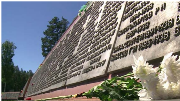
Jekaterinburge sušaudytiems politiniams kaliniams pastatytas memorialas su žuvusiųjų pavardėmis.

Į Jekaterinburgo mišką sovietai vežė nukankintus ir sušaudytus kitų tautybių veikėjus. Juos laidojo tame pačiame bendrame kape su lietuviais. Ten palaidotas ir Dovydaitis.