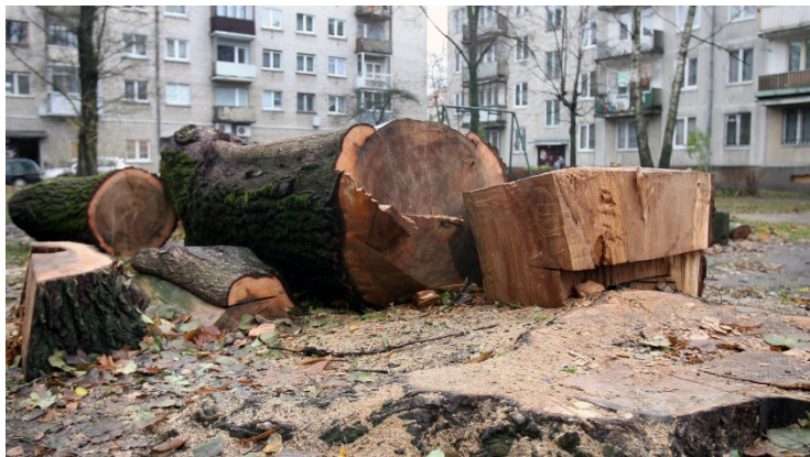
Kaune kerta sveikus medžius. (Izinius.lt nuotr.)

Kaune savivaldybė ėmė kirsti medžius. Kauniečiai pasipiktino . Jiems skaudu, kad visai sveiki medžiai kertami.