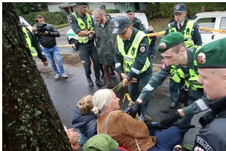
Policija suima protestuotojus.

Protestuotojai ypač pasipiktino, kad kerta kaštonus , kurie jau seniai puošia Kauno gatves. Jei skaitėte Kaupo