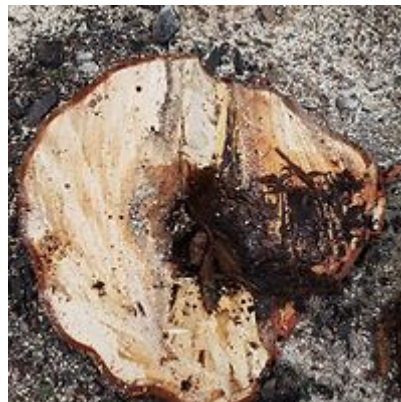
Rado, kad išpuvęs medis.

Jis aiškino, kad darbininkai ėmė medžius genėti , bet aptiko, kad jie pažeisti . Ekspertai patarė geriau sodinti naujus medžius. O jei vienas kitas medis buvo dar sveikas, reikėjo ir juos iškirsti, kad galėtų pasodinti vienodus medžius.