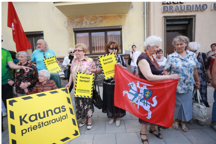
Kauniečiai protestuoja prieš medžių kirtimą.

Kaune savivaldybė ėmė kirsti medžius. Kauniečiai pasipiktino . Jiems skaudu, kad visai sveiki medžiai kertami.