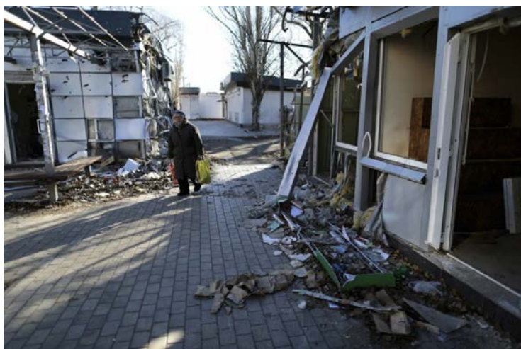
Vaizdai iš karo nusiaubtos rytų Ukrainos.

Nuo 2014 metų Lietuva kasmet priima 25 ukrainiečių mokinius iš Donecko ir Luhansko sričių, kur vyksta kovos. Su jais atvyksta ir mokytojas, kuris jiems