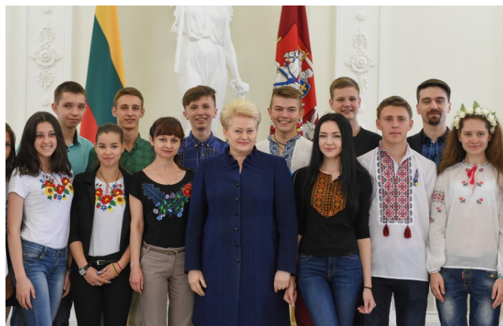
Prezidentė Dalia Grybauskaitė susitiko su mokiniais iš rytų Ukrainos.

Kasmet pasibaigus mokslo metams, keli ukrainiečiai lieka Lietuvoje mokytis toliau. Jau yra vienuoliktokų, kurie gavo leidimus gyventi Lietuvoje ir tęsti mokslus čia.