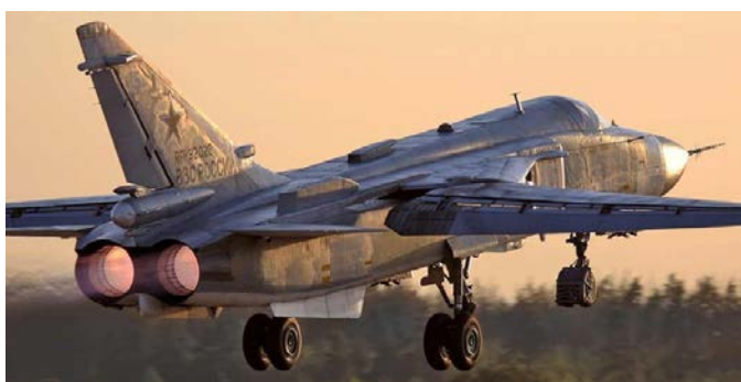
Kaliningrade bombardavo iš bombonešių.