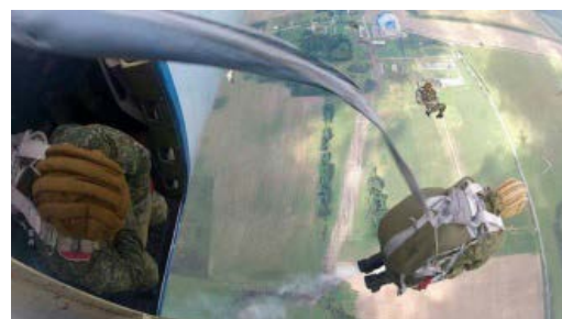
Desantininkai dalyvavo pratybose

Tačiau oficialiai pratybos buvo gynybiškos . Oficialiai kariai turėjo mokytis kovoti prieš sukilėlius. Oficialiai skelbė, kad dalyvavo maždaug 12 tūkst. karių. Iš tikrųjų dalyvavo arti 100 tūkst. karių. Pratybose dalyvavo visi Rusijos ginkluotųjų pajėgų elementai, įskaitant kosmoso pajėgas .