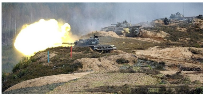
Per pratybas šaudė iš tankų prie Lietuvos sienos.

„Zapad“ – tai rusiškas žodis, kuris reiškia „Vakarai“. Taip pavadintos Rusijos ir Baltarusijos karinės pratybos , kurios vyko Lietuvos pašonėje rugsėjį. Gal tuo pavadinimu norėjo išreikšti, jog mokosi pulti NATO .