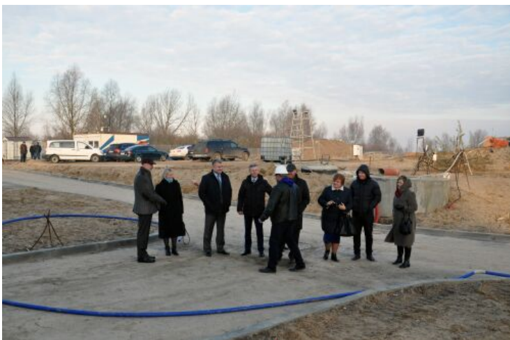
Jurbarko ir Nemano administracijų nariai tariaisi dėl vandens valymo įrengimų.

Lietuva stengiasi palaikyti draugiškus ryšius su Karaliaučiumi. Šiais metais tam tikslui skirs 18 mln. dolerių. Lėšas gaus iš Europos Sąjungos (ES).