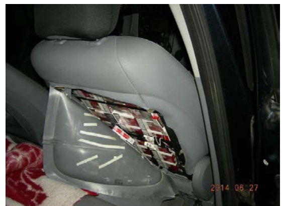
Kontrabandinės cigaretės paslėptos mašinos sėdynėje.

Ši nelegali prekyba kenkia ne tik valdžiai, bet ir tiems prekybininkams, kurie laikosi įstatymų. Gal blogiausia tai, kad nelegali prekyba puoselėja korupciją bei smurtą ir gadina žmonių dvasią.