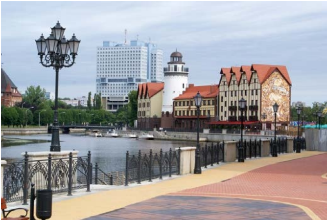
Vaizdas iš Karaliaučiaus.

Maždaug pusę sienos tarp Lietuvos ir Karaliaučiaus sudaro Nemunas. Antrą pusę sudaro žemės ruožas (žemėlapyje apvestas ovalu). Šiame ruože yra lengva pereiti iš Karaliaučiaus į Lietuvą.