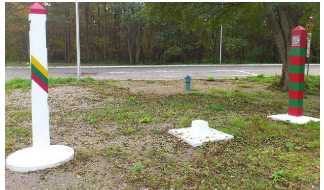
Lietuviškas ir rusiškas stulpai pažymi sieną tarp Lietuvos ir Karaliaučiaus.

Bendradarbiavimas su Karaliaučiumi jau yra davęs gerų rezultatų. Pvz., pagal Nemuną buvo pastatyti nuotekų