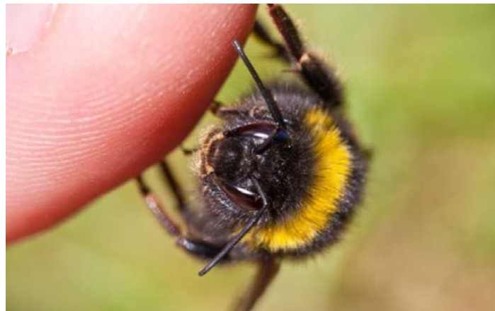
Bitė pasiruošusi įgelti ir įleisti nuodus.

Bitės bei bičių produktai yra svarbūs lietuvių liaudies medicinoje. Pavyzdžiui, bičių nuodai naudojami gydyti angių įkandimams.