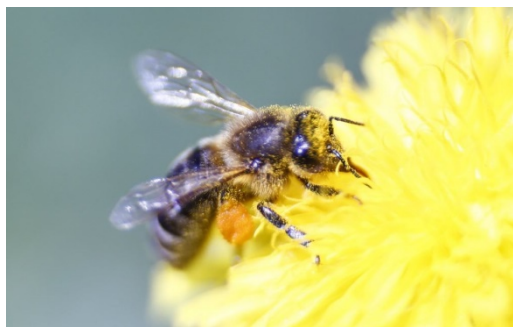
Bitė.