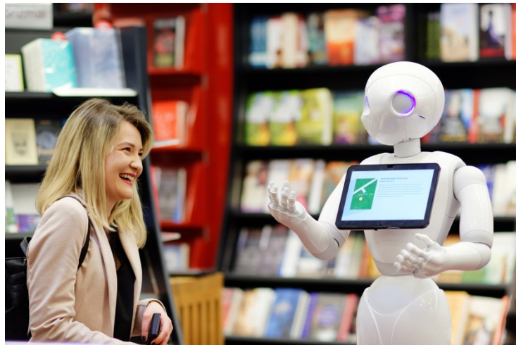
Peperis kalbasi su pirkėja.

Pavyzdžiui, pirkėjas gali norėti nupirkti dovaną 11-kos metų vaikui. Jis gali Peperio paklausti, kokių nuotykių knygų galima pirkti to amžiaus vaikams.