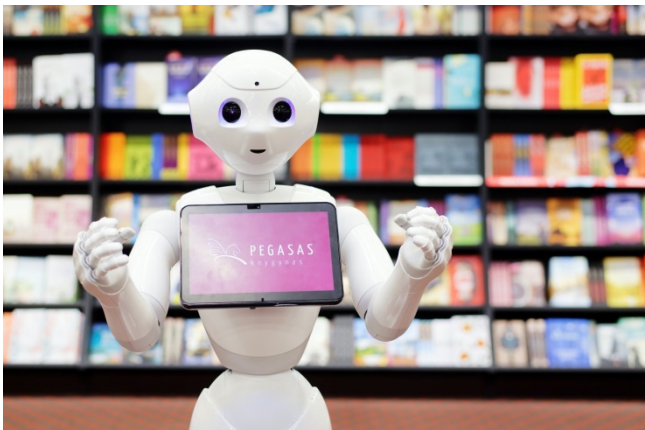
Robotas Peperis dirba Vilniaus knygyne.

Viename Vilniaus knygyne dirba robotas. Jo vardas Peperis. Jis moka kalbėti su žmonėmis – atsakyti į jų klausimus ir pats jų paklausti.