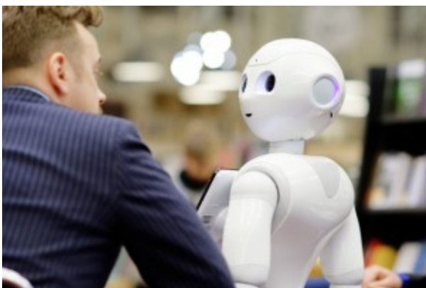
Peperis palaiko akių kontaktą su pašnekovu.

Viename Vilniaus knygyne dirba robotas. Jo vardas Peperis. Jis moka kalbėti su žmonėmis – atsakyti į jų klausimus ir pats jų paklausti.