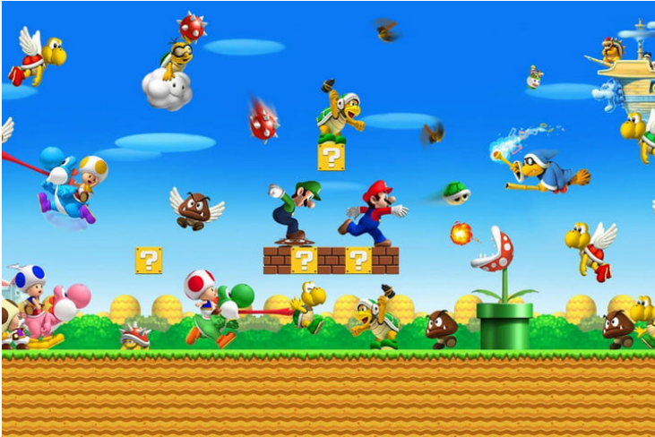
„Super Mario” žaidimas.

Gal pažįsti „Super Mario” kompiuterinį žaidimą?