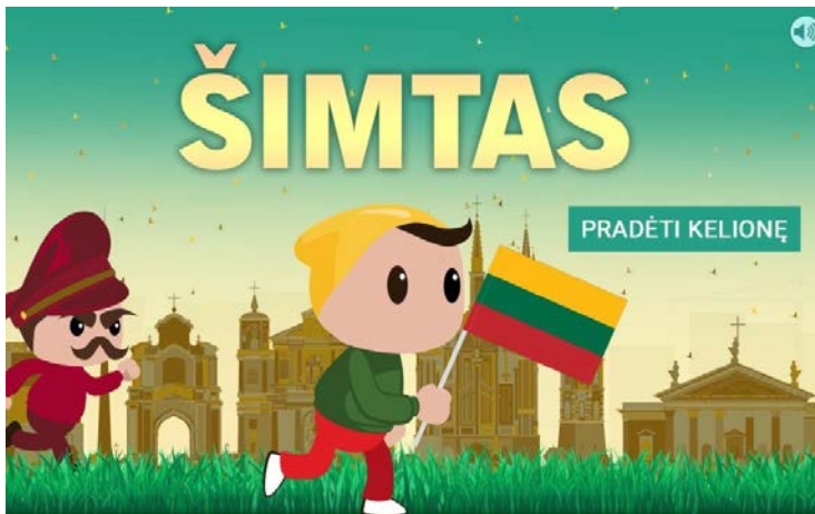
Žaidimas „Šimtas”. (delfi nuotr.)

Gal pažįsti „Super Mario” kompiuterinį žaidimą?