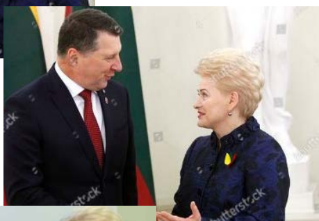
Latvijos prezidentas Raimondas Vėjuonis.