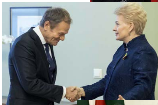
Europos Sąjungos prezidentas Donaldas Tuskas.