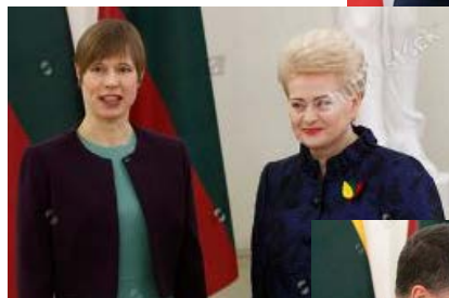
Estijos prezidentė Kersti Kaljulaid.