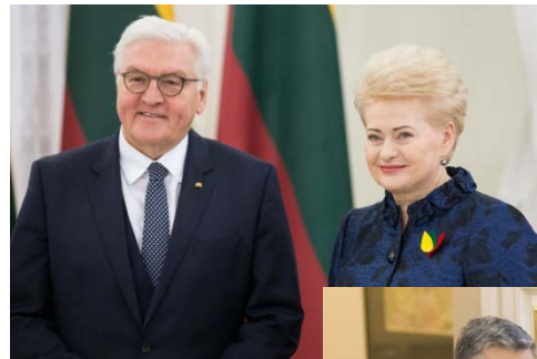
Vokietijos prezidentas Frankas-Walteris Steinmeieris.