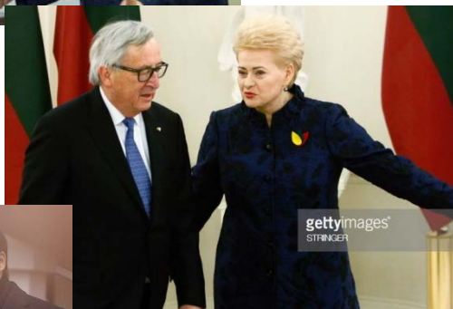
Europos Komisijos prezidentas Jean-Claude Juncker.