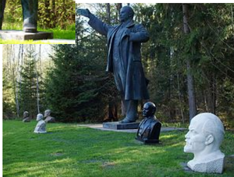
Lenino skulptūros Grūto parke.