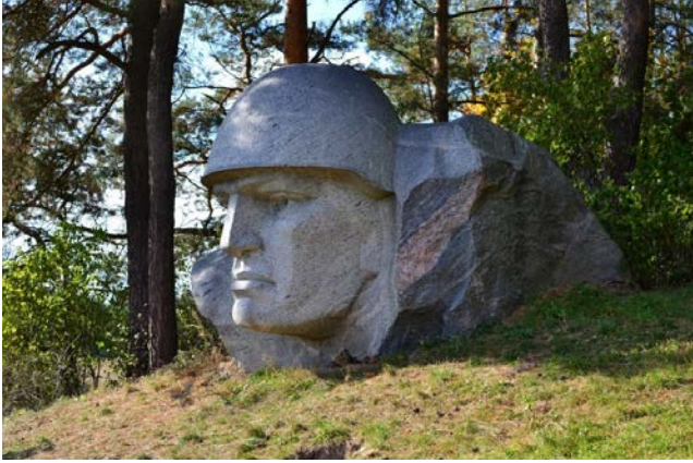
Paminklas nušautiems sovietų kariams.

Nuo sovietmečio Alytuje ant kalno stovėjo sovietinio kario paminklas. Jis patatytas sovietinių karių garbei. Spalį paminklas buvo nuridentas nuo kalno ir išvežtas į Grūto parką.