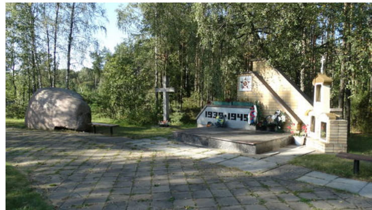
Sovietinis paminklas su kūju ir pjautuvu Visagine .

Lietuvoje dar liko nemažai sovietinių paminklų ir skulptūrų. Dalis jų stovi sovietų karių kapinėse. Lietuviai jaučia, kad reikia kapines gerbti – negalima kapų pašalinti. Negalima pašalinti ir paminklo, kuris stovi viduryje kapinių.