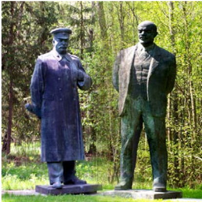
Stalino ir Lenino skulptūros Grūto parke.

Grūto parkas yra sovietinių paminklų muziejus. Jame stovi daug pašalintų sovietinių skulptūrų ir paminklų.