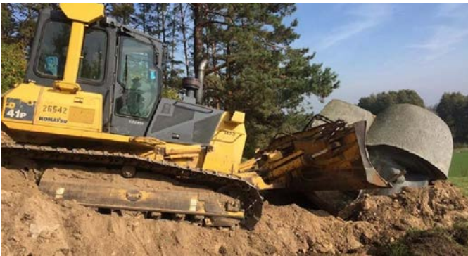
Ruošiasi išvežti sovietinio kario skulptūrą.

Nuo sovietmečio Alytuje ant kalno stovėjo sovietinio kario paminklas. Jis patatytas sovietinių karių garbei. Spalį paminklas buvo nuridentas nuo kalno ir išvežtas į Grūto parką.