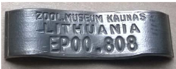
Juodkrantėje ant balinės pelėdos užmautas žiedas.

Balinės pelėdos rudenį skrenda iš Lietuvos į šiltesnius kraštus prie Viduržemio jūros . Šita pelėda skrido į Pietų Prancūziją.