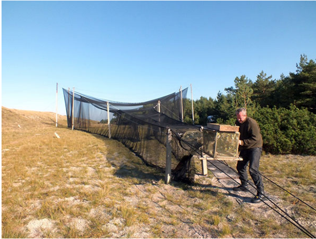
Žiedavimo stotis Juodkrantėje.

Spalio 1 d. Juodkrantėje sužiedavo balinę pelėdą . Lietuvos ornitologai džiaugėsi, nes tai labai retas įvykis . Nuo 1929 m. iš viso sužieduota tik 30 balinių pelėdų.