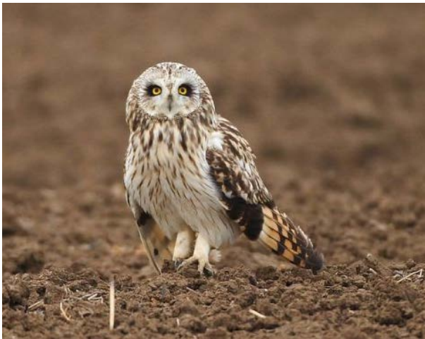
Balinė pelėda.

Spalio 1 d. Juodkrantėje sužiedavo balinę pelėdą . Lietuvos ornitologai džiaugėsi, nes tai labai retas įvykis . Nuo 1929 m. iš viso sužieduota tik 30 balinių pelėdų.