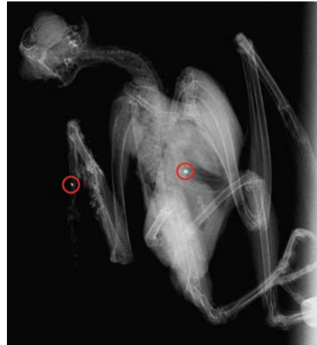
Pelėdos rentgeno nuotrauka su šratais.

Praėjus dviem savaitėm, spalio 15 d., iš Prancūzijos atskriejo liūdna žinia – prieš dvi savaites sužieduota pelėda buvo rasta negyva.