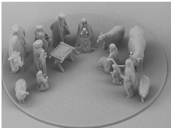
Kas per mikroskopą matosi.

Prezidentė Dalia Grybauskaitė perdavė popiežiui Pranciškui lietuvių mokslininkų ir studentų sukurtą kalėdinę dovaną – mažiausią pasaulyje prakartėlę . Ji tokia maža, kad ją galima matyti tik per mikroskopą.