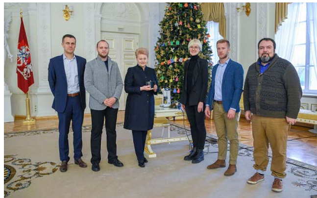
Prezidentė Grybauskaitė su mokslininkais ir studentais, kurie sukūrė prakartėlę.

Ji tokia unikali, kad pateko į Gineso rekordų knygą kaip mažiausia pasaulyje prakartėlė. Gineso rekordų agentūra pranešė, kad pasaulyje nėra niekas nieko panašaus sukūręs, prakartėlė unikali.