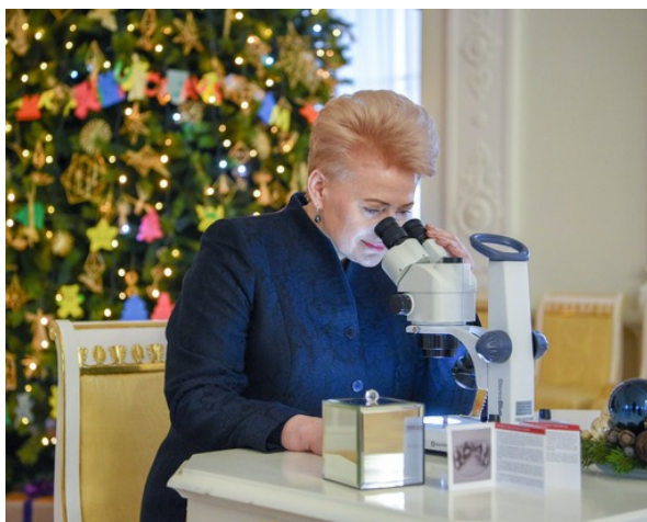
Prezidentė Dalia Grybauskaitė žiūri į dovaną popiežiui.

Prezidentė Dalia Grybauskaitė perdavė popiežiui Pranciškui lietuvių mokslininkų ir studentų sukurtą kalėdinę dovaną – mažiausią pasaulyje prakartėlę . Ji tokia maža, kad ją galima matyti tik per mikroskopą.