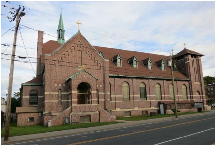
Šv. Andriejaus lietuvių bažnyčia, kur buvo pakrikštytas Ramanauskas-Vanagas.

pagrindinių partizanų vadų. KGB jį pagavo 1956 m., žiauriai nukankino ir 1957 m. nužudė.