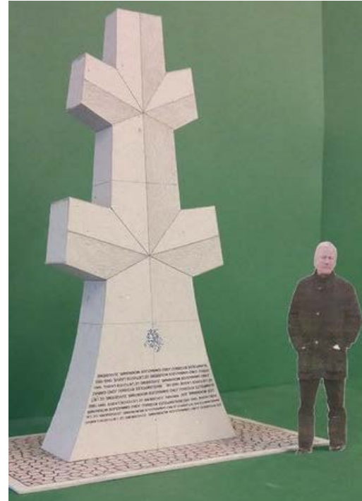
Taip atrodoys paminklas Ramanauskui- Vanagui.

Paminklas stovės atskiroje aikštėje. Prie paminklo bus informacinis stendas ir suoliukai.