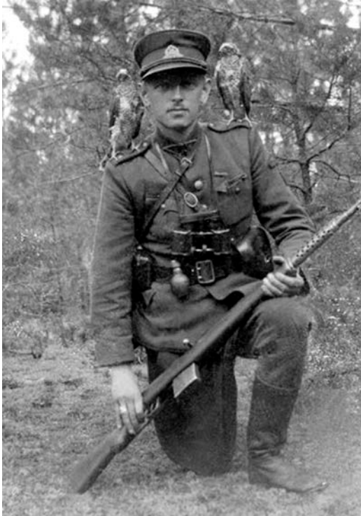
Partizanų vadas Adolfas Ramanauskas- Vanagas.

Adolfas Ramanauskas- Vanagas buvo vienas