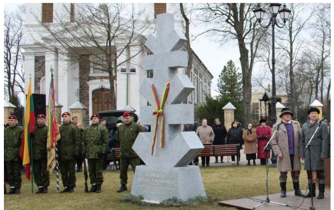
Paminklas Ramanauskui-Vanagui Lazdijuose.

Šis ženklas Lietuvoje yra plačiai naudojamas kuriant partizanams paminklus.