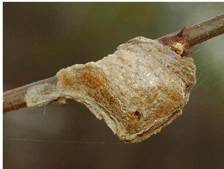
Kiaušinėliai apsauginėje kapsulėje.

Entomologų nuomone tokia maža yra šių vabzdžių populiacija, kad ji negali paveikti kitų vabzdžių populiacijos. Entomologai stebi, kaip jie plinta, kaip jie įsitvirtina, bet jokios žalos nepastebi.