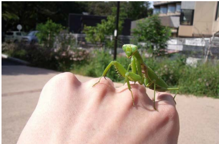
Vabzdys maldininkas aptiktas Lietuvoje.

Vabzdys maldininkas gyvena šiltuose klimatuose. Tačiau 2008 m. jis buvo aptiktas Lietuvoje. Tais metais penki suaugę vabzdžiai buvo pastebėti rugpjūčio mėnesį įvairiose Vilniaus vietose.