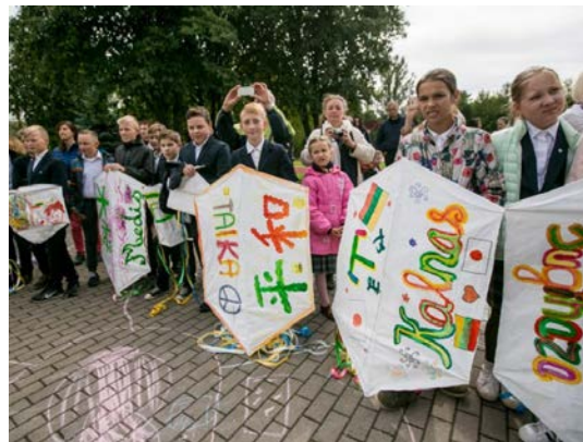
Kauniečiai išmoko gaminti japoniškus aitvarus.

Kauniečiai susipažino su Japonijos kultūra iš arti. Klausėsi tradicinių japoniškų būgnininkų, išmoko gaminti japoniškus aitvarus.