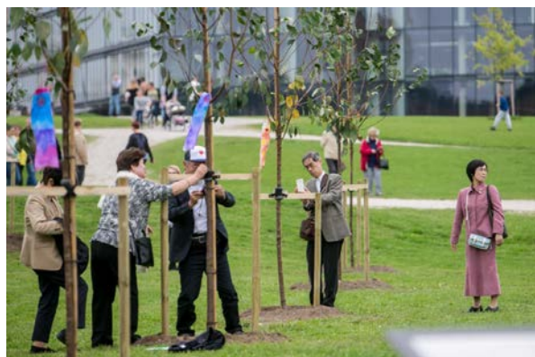
Kauno saloje sodinamos sakuros.

Kauno saloje buvo pasodinta 50 sakurų . Sakurų parkas simbolizuos draugystę tarp Lietuvos ir Japonijos.