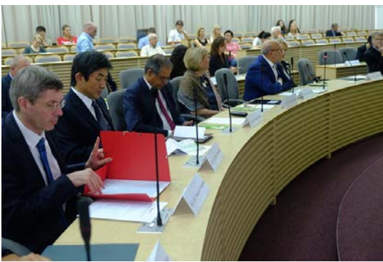
Sugiharos savaitės tarptautinis simpoziumas.

Vytauto didžiojo universiteto patalpose vyko tarptautinis simpoziumas „Diplomatai, gelbėję žydų gyvybes.“