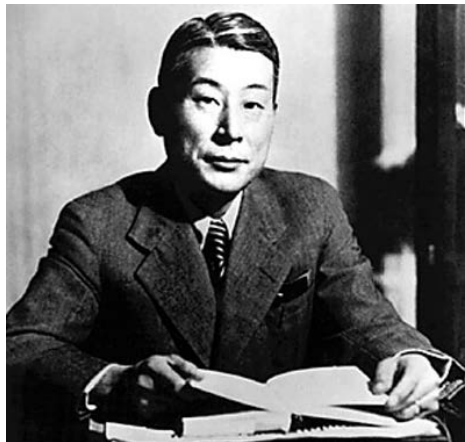
Chiune Sugihara.

Šių metų rugsėjį Kaune antrą kartą įvyko Sugiharos savaitė. Šia savaitė lietuviai nori įamžinti buvusio Japonijos konsulo Lietuvoje, Čijunės Sugiharos, atminimą.