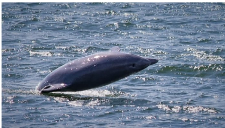
Delfinai žaidė.

Žmonės lankėsi Smiltynėje , netoli Jūrų muziejaus. Staiga, visai netoli, vandenyje pamatė du delfinus. Visi subėgo pasižiūrėti.