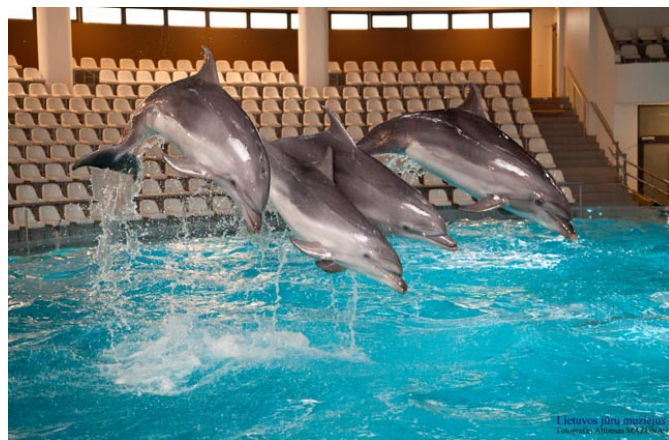
Delfinariumo delfinai.

Lietuvos jūrų muziejuje yra delfinariumas. Gal vieni žmonės pagalvojo, kad delfinariumo delfinai ištrūko į laisvę ir plaukioja Baltijos vandenyse.