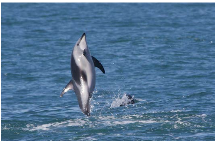
Delfinai šoko iš vandens.

Delfinai šokinėjo iš vandens, išdykavo. Išmetė aukštyn žuvis ir pagavo. Atrodė, kad jiems ten buvo labai smagu.