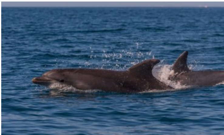
Baltijos jūroje prie Klaipėdos plaukė du delfinai.

Žmonės lankėsi Smiltynėje , netoli Jūrų muziejaus. Staiga, visai netoli, vandenyje pamatė du delfinus. Visi subėgo pasižiūrėti.