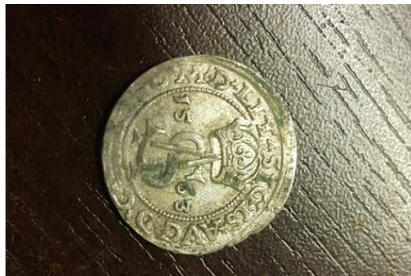
Moneta datuota 1563 metais.

Turbūt tas, kuris pinigus užkasė buvo pirklys , bet ne labai turtingas.