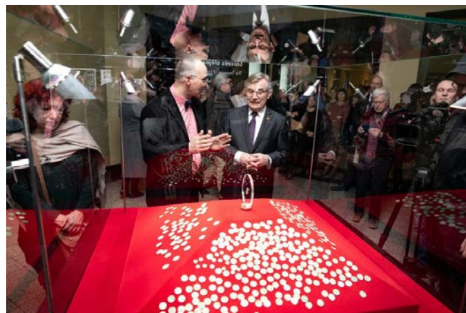
Žmonės stebi po gatve rastą lobį.

Matyt pirklys užkasė ten savo pinigus, nes norėjo pabėgti iš miesto. Tačiau niekada negrižo pinigų iškasti.