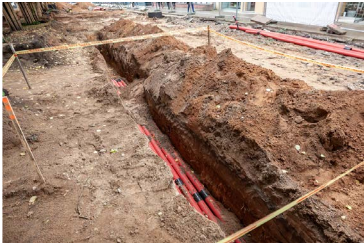
Tiesė elektros lynus po Laisvės alėjos grindiniu.

Vasarą darbininkai tiesė elektros lynus Laisvės alėjoje Kaune.