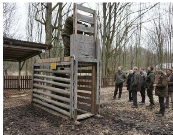
Stumbrų gaudyklė.

Jie stato stumbrų gaudykles. Gaudyklėse perveš stumbrus iš vidurio Lietuvos į Dainavos girią Dzūkijoje . Tai bus sunki, bet reikalinga operacija.