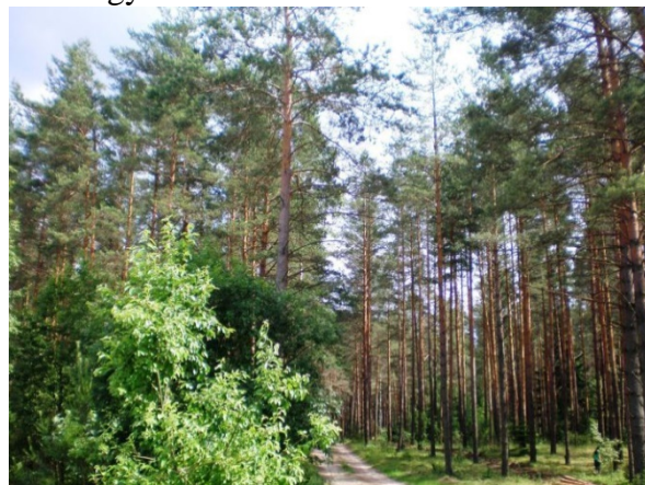
Dainavos giria.

Specialistai supranta, jog vidurio Lietuva nėra gera vieta stumbrams gyventi.