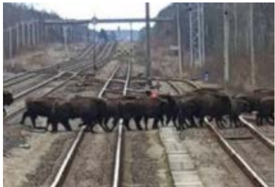
Stumbrai kirto bėgius.

Pavasarij vyksta stumbrų migracija . Tai žmonėms labai pavojingas procesas.