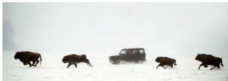
Šiuo metu po Panevėžio ir Kėdainių regionus laisvėje klaidžioja apie 200 stumbrų.

Kita stumbrų banda ėjo šalia A8 kelio. Lengvai galėjo išbėgti į kelią. Vairuotojai turėjo būti atsargūs, nes avarija su stumbru gali būti mirtina ir stumbrui, ir keliautojui.