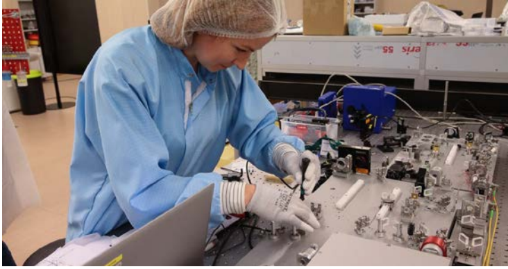
Lietuvė mokslininkė dirba su lazeriais . (vz.lt nuotr.)

Vasario 11-oji yra tarptautinė Mergaičių ir moterų moksle diena. Žmonės tiki, jog šalis, kuri nori būti konkurencinga , turi skatinti moteris domėtis griežtaisiais mokslais .