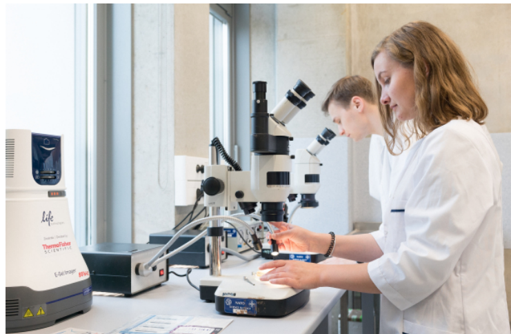
Studentė VU biomokslų laboratorijoje.

Lietuva stipriai stovi biomokslų srityje. Lietuvės kaip tik ir domisi biomokslais. 55 proc. biomedicinos mokslus studijuojantys studentai yra moterys.