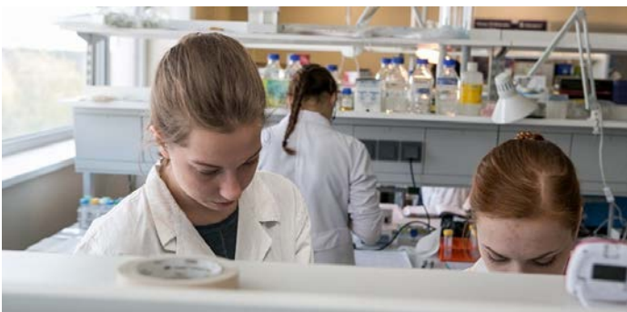
Moksliontės KTU laboratorijoje.

Tačiau trijose ES valstybėse moterys lenkia vyrus – Lietuvoje, Bulgarijoje ir Latvijoje. Lietuvoje inžinierės ir mokslininkės sudaro 58 proc., Bulgarijoje – 54 proc., o Latvijoje – 52 proc.