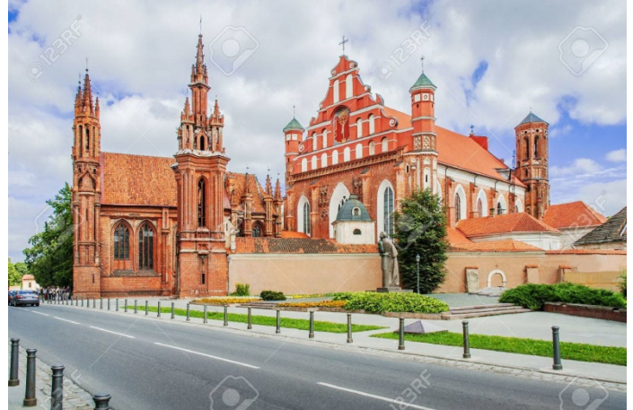
Šv. Onos bažnyčia ir Bernardinų vienuolyno pastatai.

Praėjusią vasarą Bernardinų vienuolyną aplankė mokinės iš Prancūzijos . Joms labai patiko „Šventųjų laiptų“ koplyčia. Jos būtinai norėjo „Šventaisiais laiptais“ užlipti ant kelių.