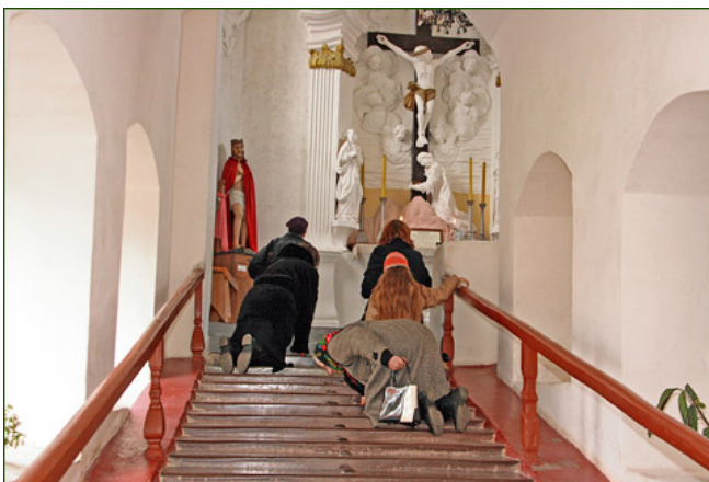
Žmonės keliais lipa į Tytuvėnų koplyčia.

Norint į ją patekti, reikia užlipti laiptais, kuriuos sudaro 28 pakopos . Kiekvienoje pakopoje yra stiklinė kolba į kurią yra įdėta žemės iš Jeruzalės . Laiptai ypatingi ir dėl to, kad jais lipama keliais .