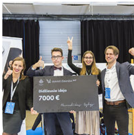
„Gluko Carer“ komanda laimėjo finansavimą savo idėjai.

Lietuvoje vyksta keli konkursai, per kuriuos galima stengtis gauti finansavimą savo idėjoms. 2017 m. „Gluko Carer“ komanda dalyvavo konkurse „Vilnius išranda“. Jiems pasisekė gauti finansavimą savo idėjai įvykdyti .