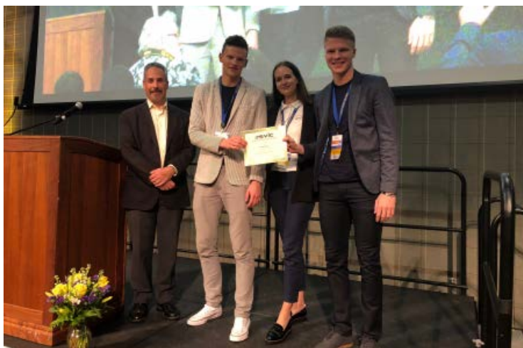
KTU studentai priima pažymėjimą – trečią vietą konkurse.

Kasmet San Jose State universitete vyksta idėjų konkursas „Silicon Valley Innovation Challenge“. 2018 m. lapkritį buvo pristatyti 200 projektų.