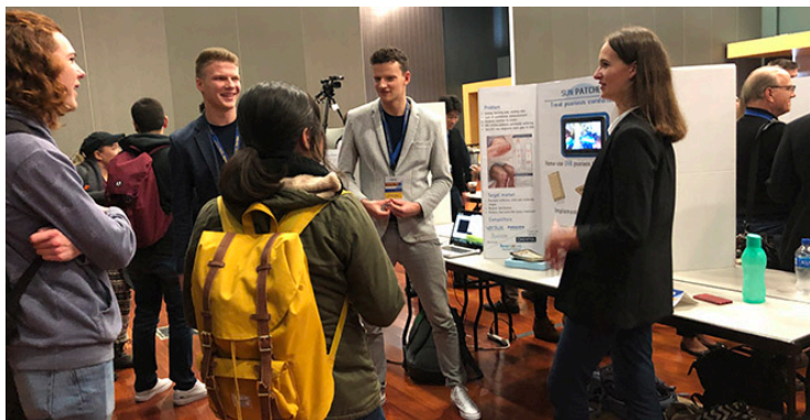
KTU studentai pristato idėją 2018 m. konkurse.

Kasmet San Jose State universitete vyksta idėjų konkursas „Silicon Valley Innovation Challenge“. 2018 m. lapkritį buvo pristatyti 200 projektų.