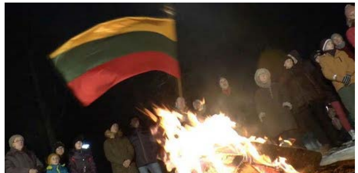
Laužas už žuvusius Sausio 13-ąją.

Žmonės dalyvavo eisenose Sausio 13-osios aukoms atminti.