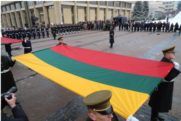
Vėliavos pakėlimo ceremonija Nepriklausomybės aikštėje.

Sausio 13-oji – Laisvės gynėjų diena. Tą naktį 1991 m. prie Televizijos bokšto sovietų kariai užpuolė beginklius lietuvius, kurie budėjo gindami Lietuvos laisvę.