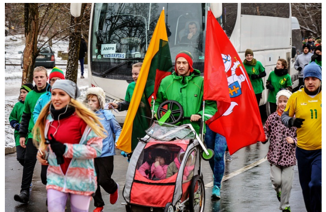
Bėgimas „Gyvybės ir mirties keliu“.

Jie kūrė atminimo laužus žuvusiems prisiminti.